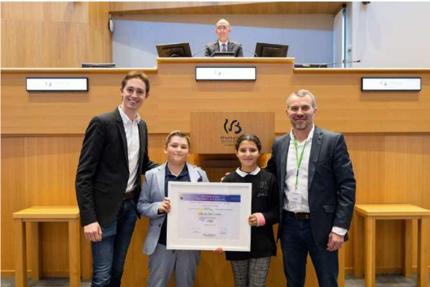
Facebook—Ecole Saint-Louis Huy