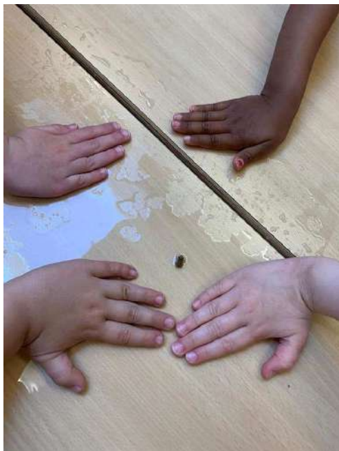
Les élèves de M2

Nous avons observé la vie dans la mare et avons rendu la liberté à nos petits compagnons.